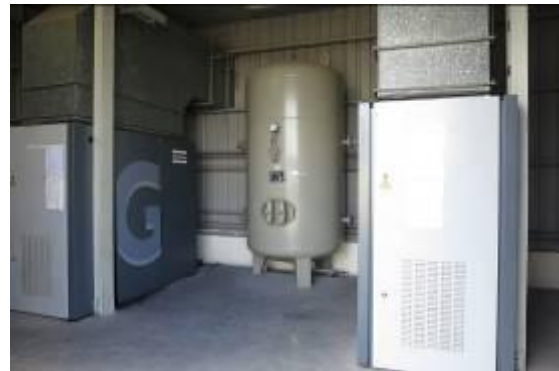
Hình ảnh trạm khí nén

Tiêu thụ điện của hệ thống khí nén chiếm khoảng 4% tiêu thụ điện năng của toàn Công ty. Hệ thống khí nén của Công ty gồm 2 máy nén khí Atlas Copco, có cùng công suất 45 kW. Các máy đều được trang bị thiết bị biến tần Siemens. Trạm khí nén hoạt động 24 giờ mỗi ngày.