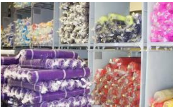
Hình ảnh sản phẩm

Sản phẩm của Công ty là các loại vải dệt kim độ dày có chất lượng cao, cung cấp cho thị trường khu vực Châu Á. Hàng năm, Công ty sản xuất hơn 20 triệu mét vải các loại.