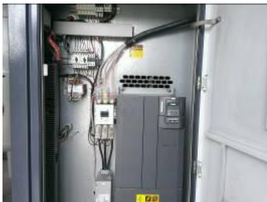
Biến tần Siemens cho máy nén khí

Ngay từ khi xây dựng, Công ty đã tính đến 2 phương án đầu tư máy nén khí: có biến tần và không có biến tần. Kết quả tính toán cho thấy máy nén khí chạy theo biến tần so với máy nén khí chạy theo chế độ có tải/không tải (không có biến tần) có thể tiết kiệm 20 ÷ 30% điện năng.