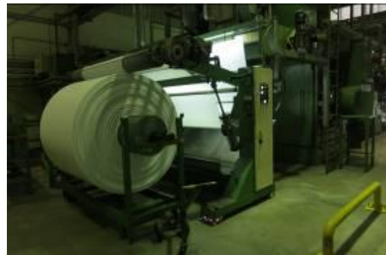
Thiết bị sử dụng khí nén

22%. Nếu máy chạy theo chế độ có tải/không tải, điện năng tiêu thụ khoảng 338.000 kWh/năm. Trong khi trang bị biến tần, điện năng tiêu thụ của máy nén khí chỉ là 263.000 kWh/năm. Như vậy, việc trang bị máy nén khí có tích hợp biến tần giúp Công ty tiết kiệm được 75.000 kWh/năm. Để đầu tư thêm 2 biến tần Siemens, Công ty cần đầu tư 178 triệu. Thời gian hoàn vốn của giải pháp là 21,3 tháng.